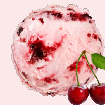
ÅRETS ÖVERRASKNING Körsbär