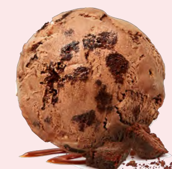
ÅRETS RAKET Brownie